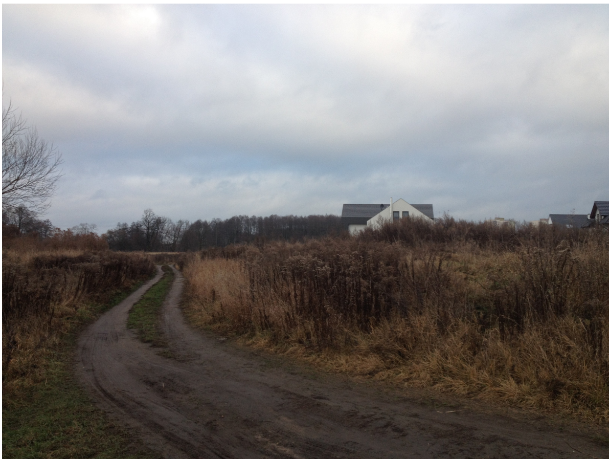
Fot. 31. Droga gruntowa prowadząca z ul. Małgorzaty na północ.