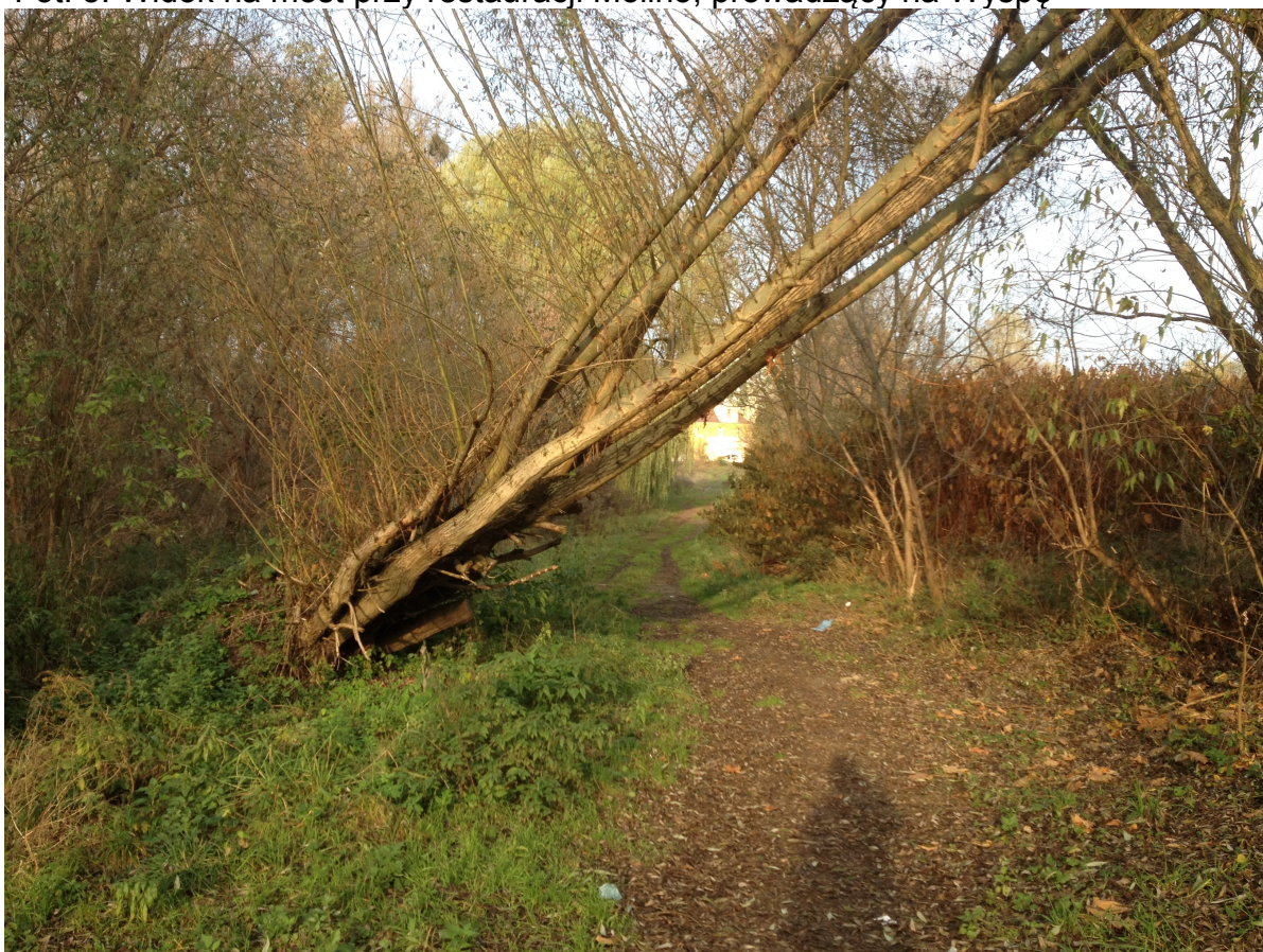
Fot.6. Ścieżka prowadząca z ciągu pieszo-rowerowego do ul. Dąbrowskiego. Po lewej myjnia samochodowa.