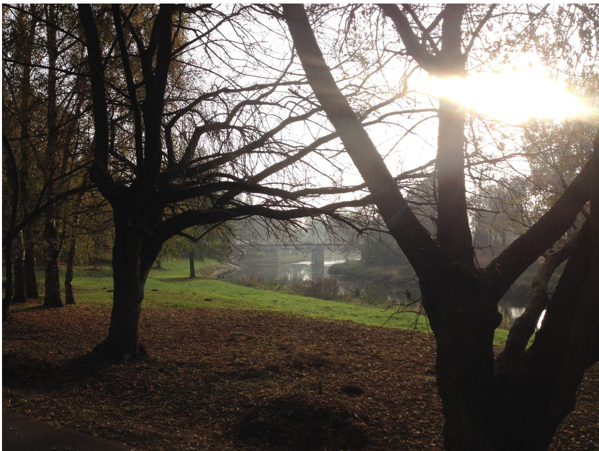
Fot. 5. Widok na most przy restauracji Molino, prowadzący na Wyspę