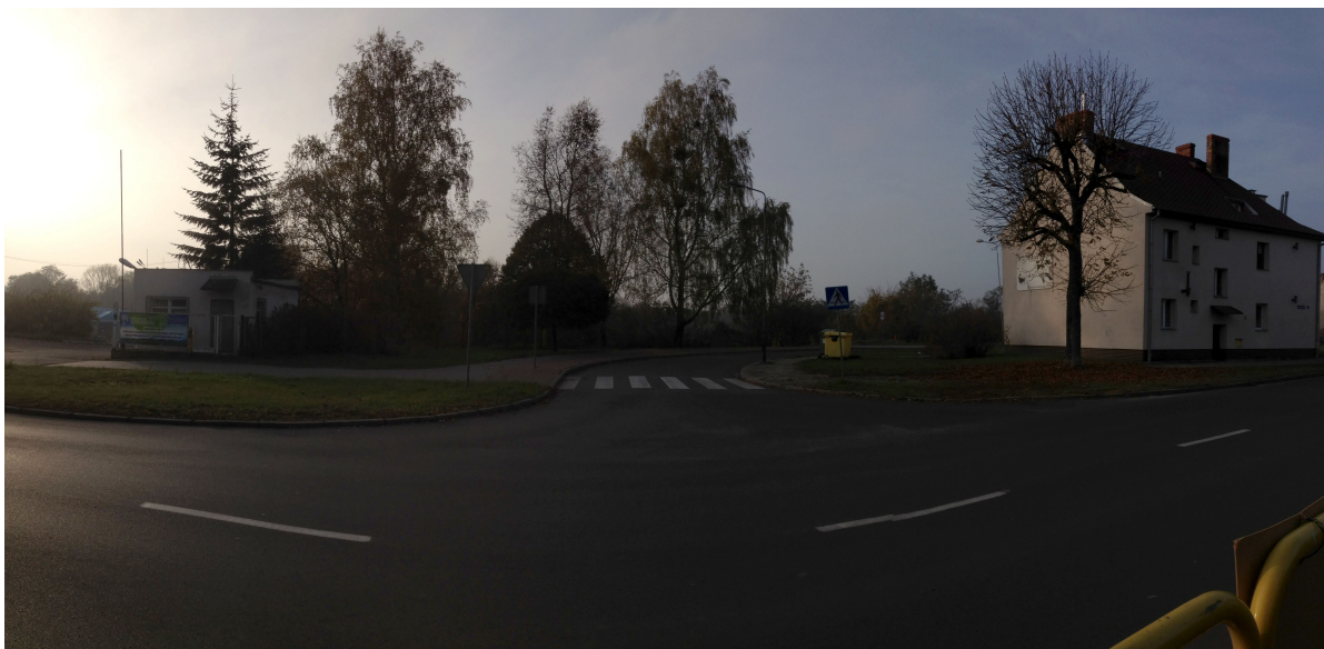
Fot.9. Skrzyżowanie ul. Dąbrowskiego i Śniadeckich.