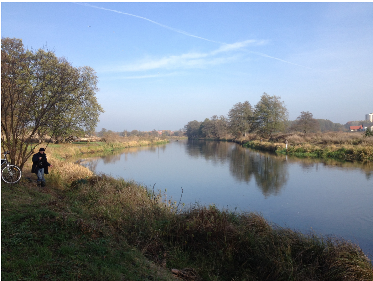
Fot. 25. Widok na rzekę Gwdę z jej prawego brzegu powyżej Mostów Królewskich