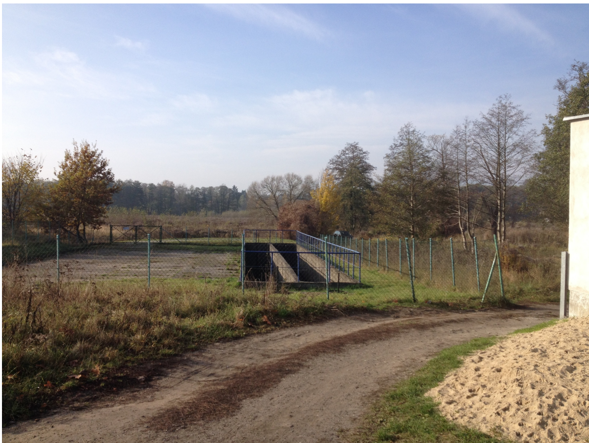
Fot. 17. Osadnik przy starorzeczu (ul. Dąbrowskiego, al. 500 Lecia Piły).