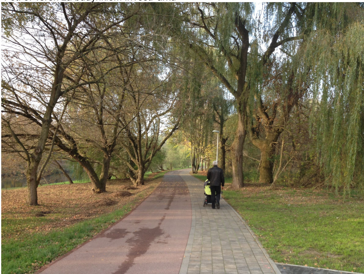
Fot. 4. Ciąg pieszo-rowerowy prowadzący do Mostów Królewskich