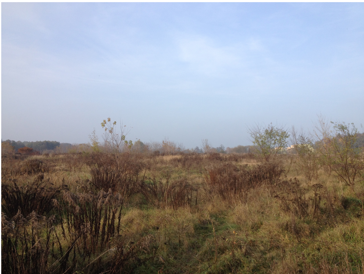
Fot. 7. Widok na nieużytki od strony południowej.