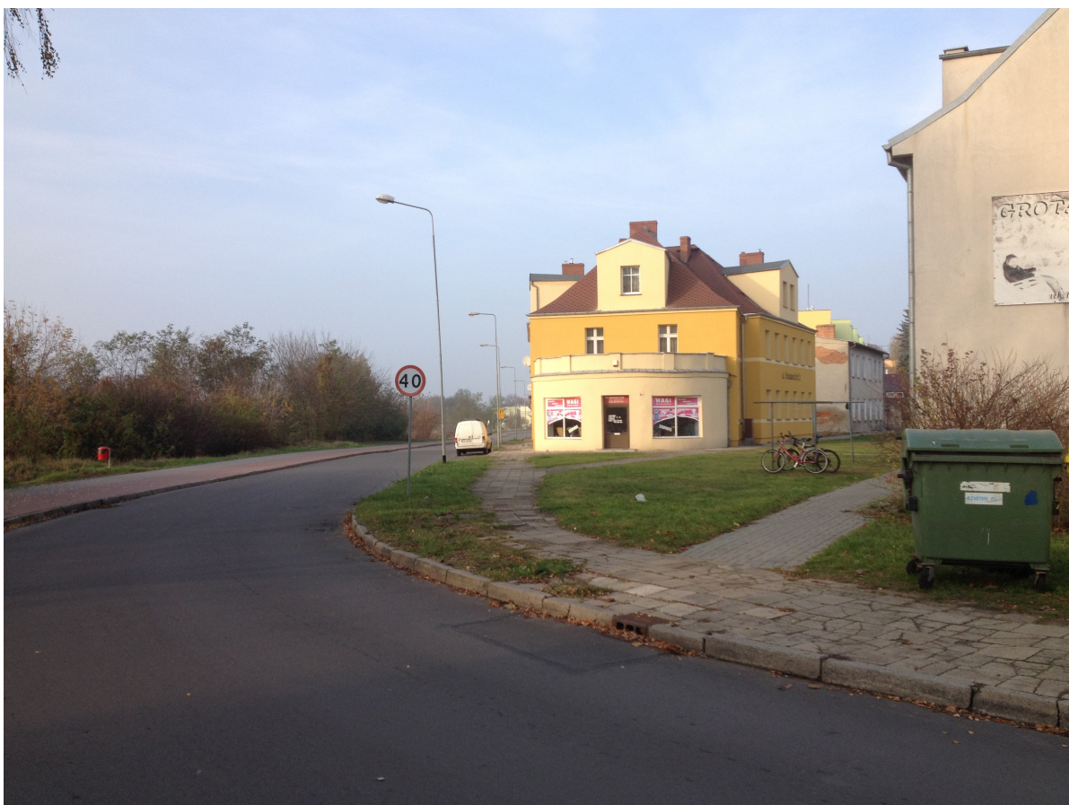
Fot. 10. Zabudowa przy zbiegu ulic Dąbrowskiego i Śniadeckich.