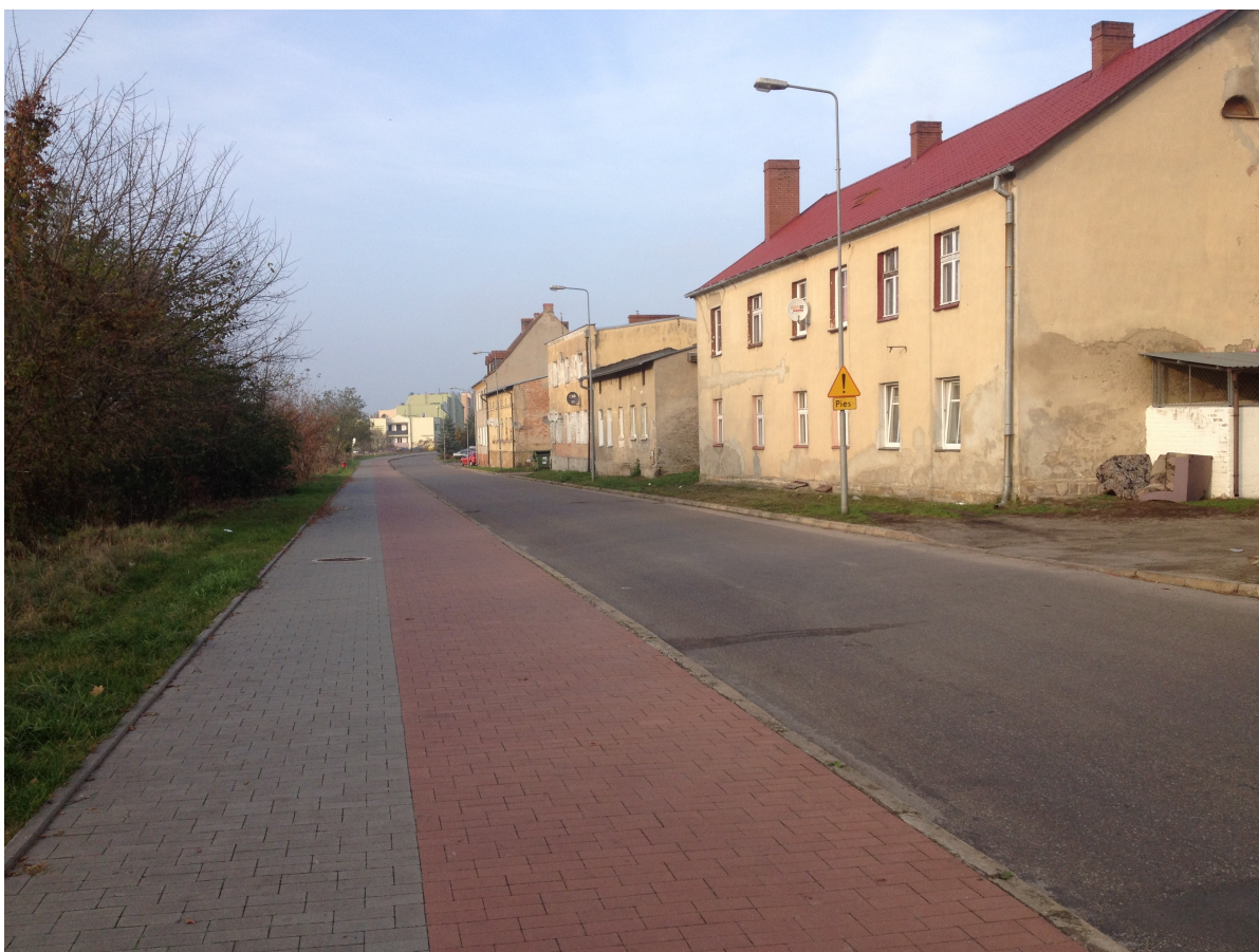
Fot. 12. Ulica Dąbrowskiego, istniejąca zabudowa i ciąg pieszo-rowerowy.