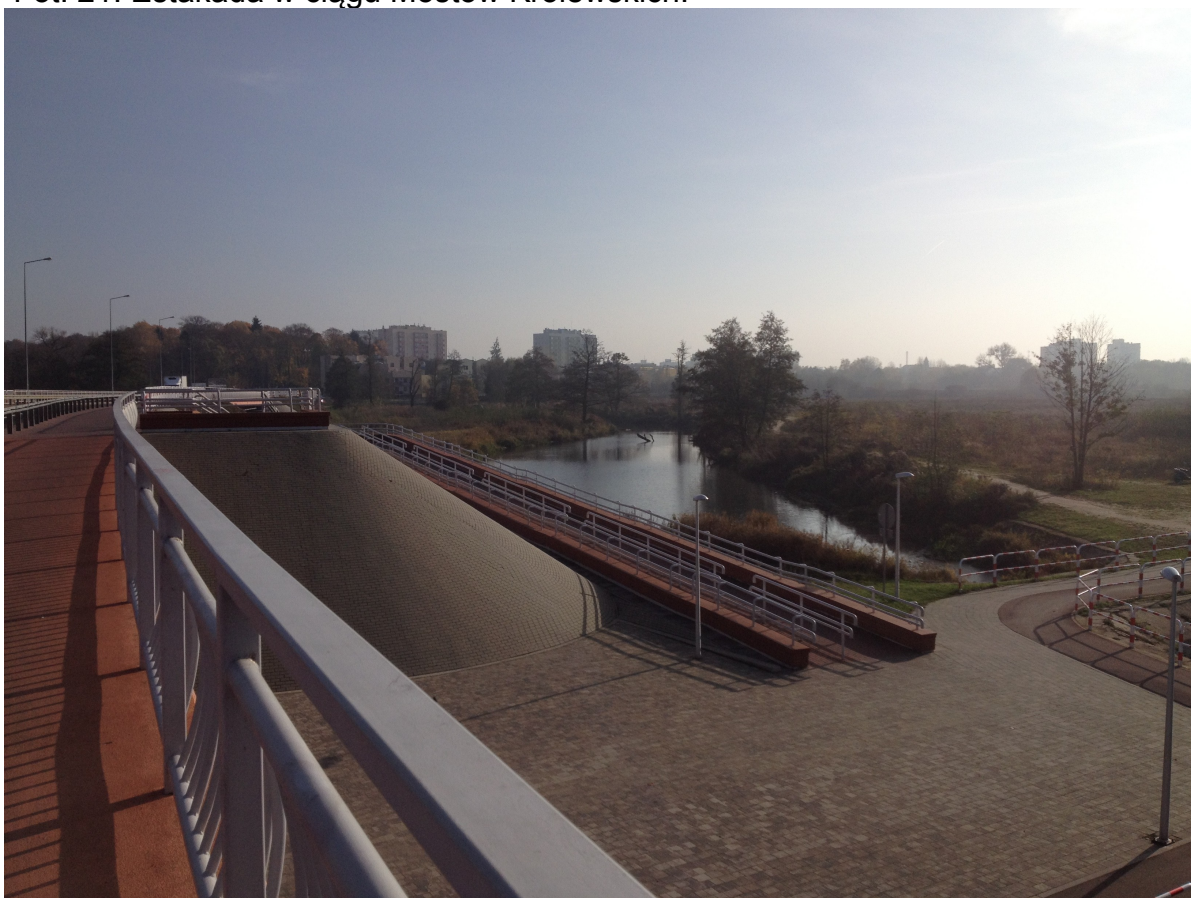
Fot. 22. Widok z Mostów Królewskich na starorzecze oraz na rampę prowadzącą do ciągu pieszo-rowerowego nad Gwdą