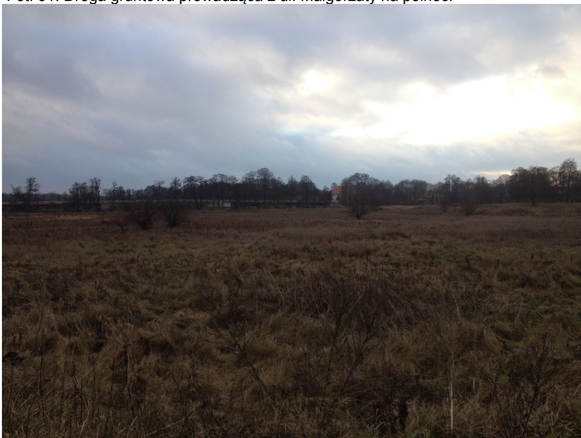
Fot. 32. Widok z okolic ul. Małgorzaty w stronę Mostów Królewskich.