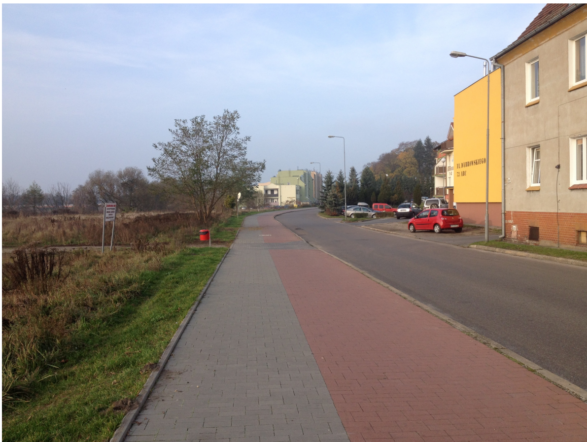
Fot. 13. Istniejący zjazd na ul. Dąbrowskiego z dawnego wysypiska gruzu.