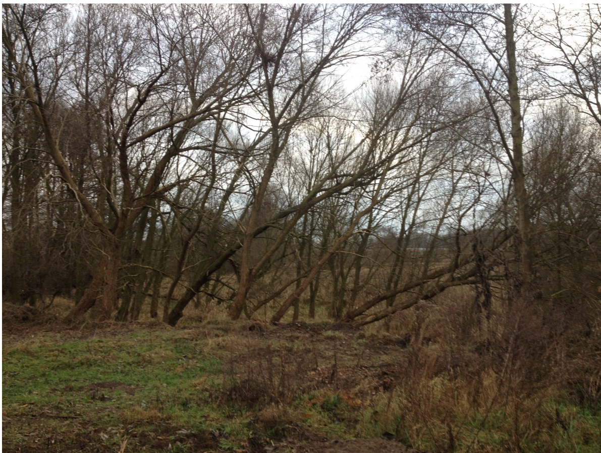
Fot. 29. Widok z ul. Małgorzaty w kierunku południowym.