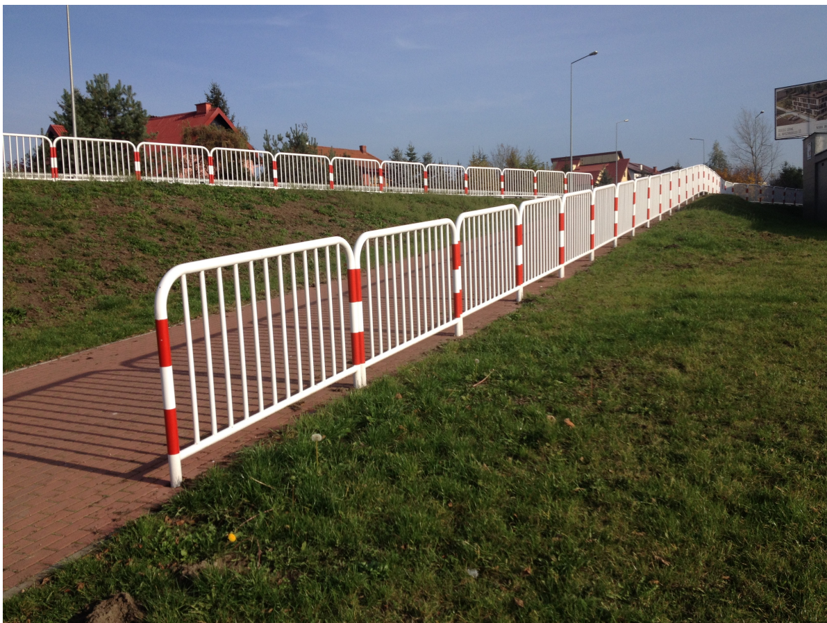
Fot. 19. Zjazd ciągu pieszo-rowerowego na al. 500 Lecia Piły prowadzący pod most.