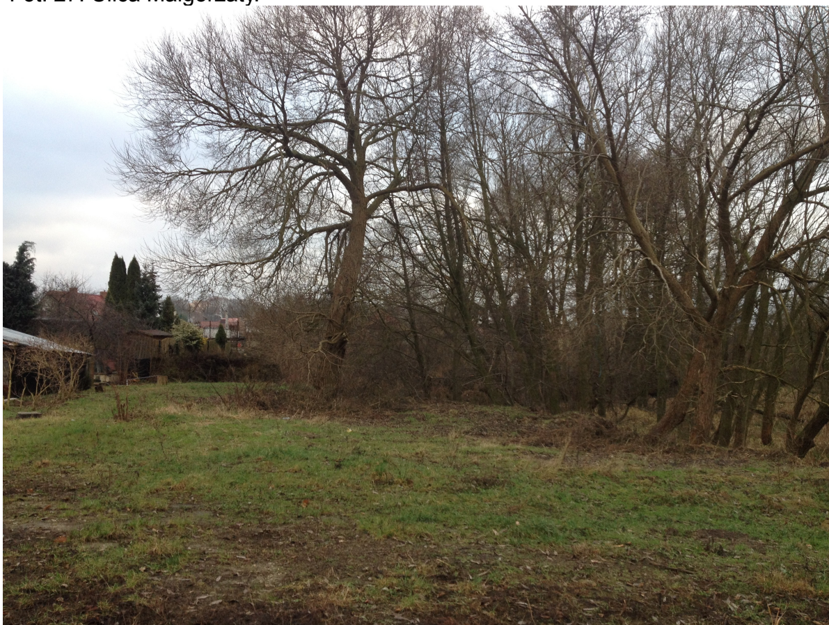
Fot. 28. Widok z ul. Małgorzaty w kierunku południowym