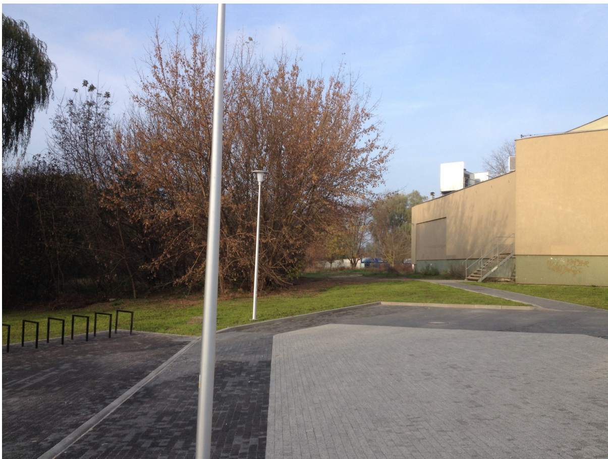
Fot. 3. Teren za budynkiem InvestParku