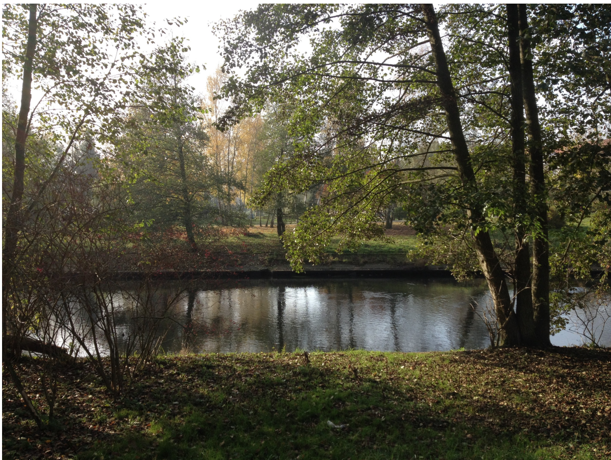
Fot. 15. Widok z lewego brzegu Gwdy w miejscu planowanej kładki.