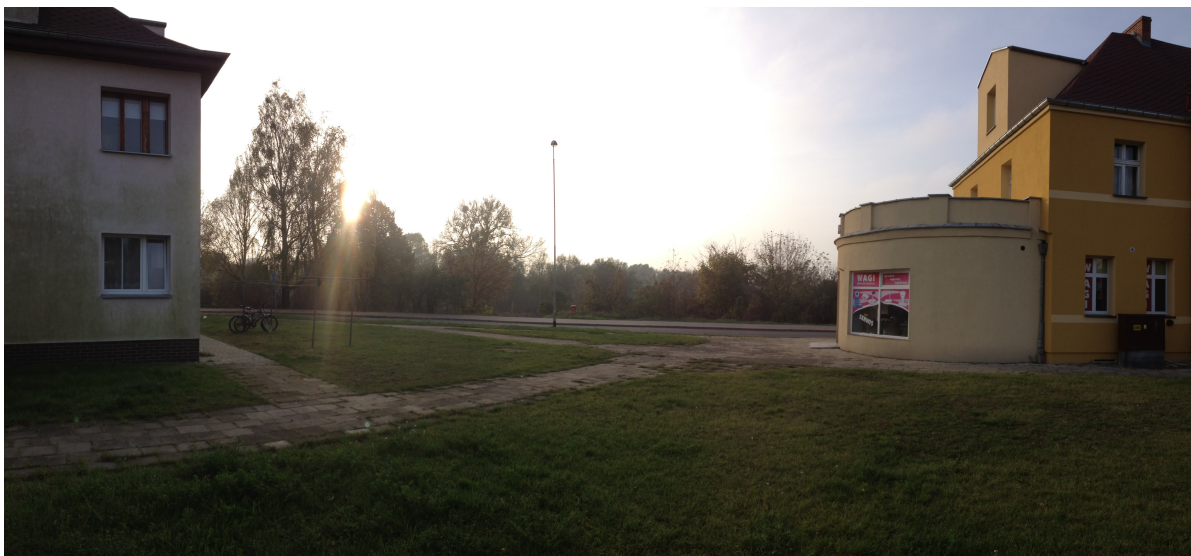
Fot. 11. Widok z ulicy Śniadeckich na obszar opracowania