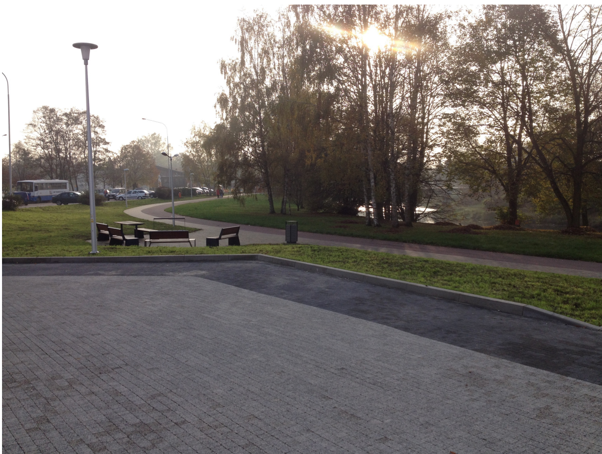
Fot. 1. Ciąg pieszo-rowerowy z miejscem piknikowym przy budynku InvestParku.