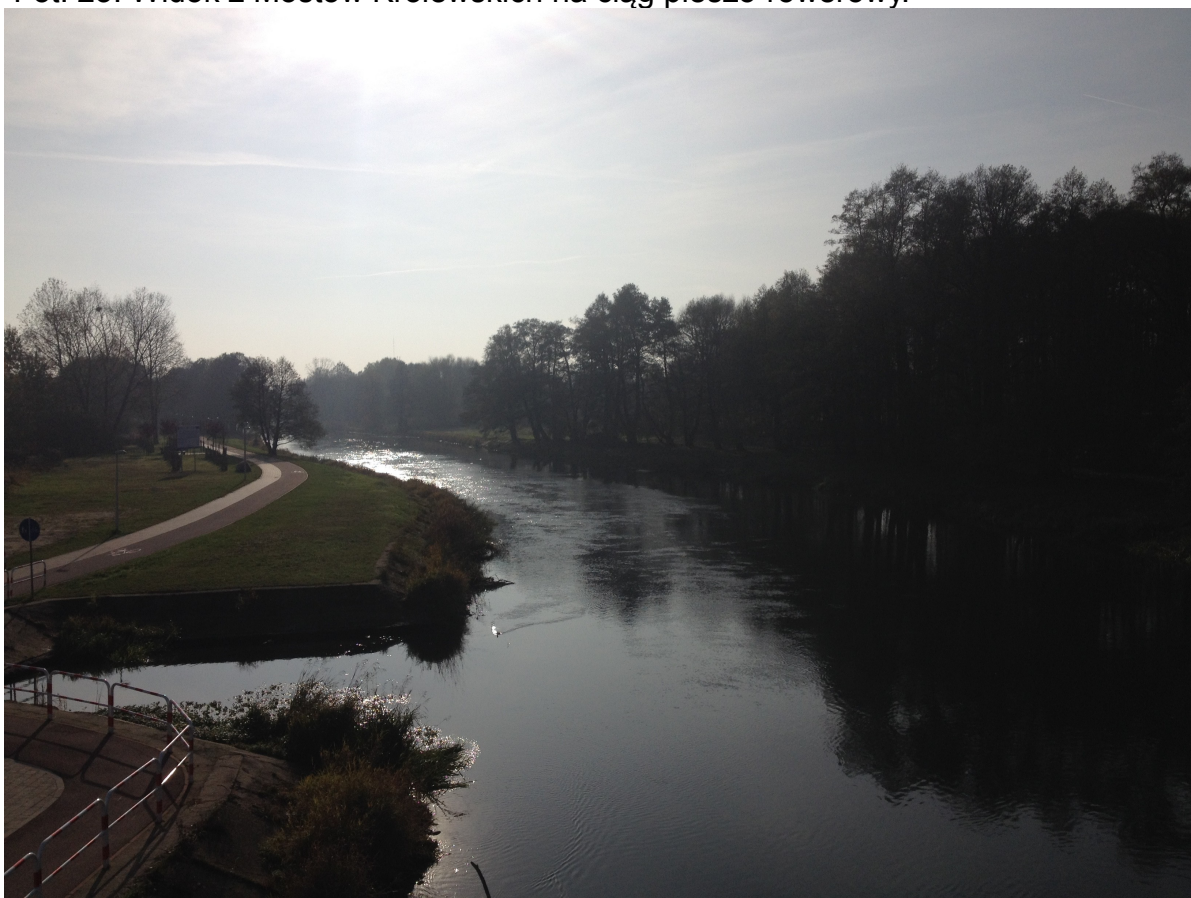
Fot. 24. Widok z Mostów Królewskich na Gwdę.