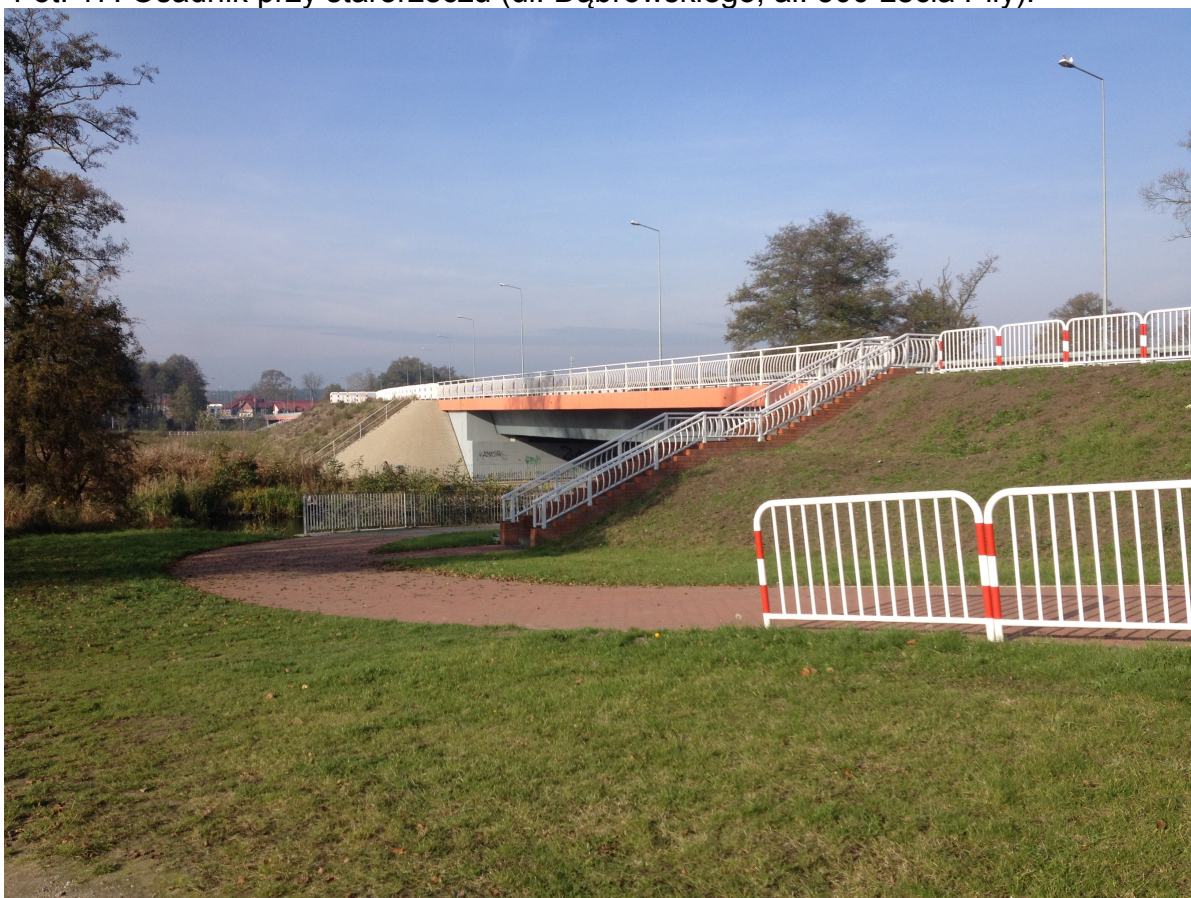
Fot. 18. Most na starorzeczu oraz zejście i zjazd ciągu pieszo-rowerowego na al. 500 Lecia Piły prowadzący pod most.