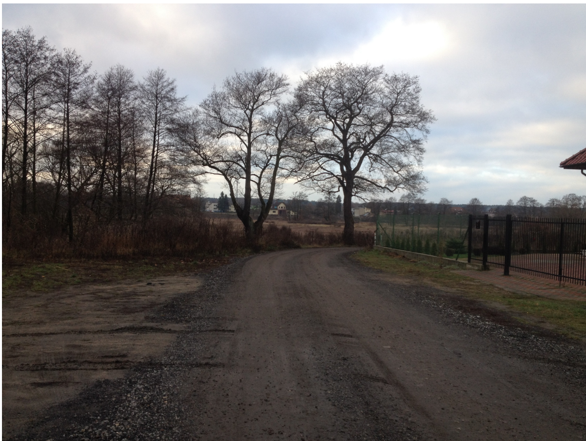
Fot. 27. Ulica Małgorzaty.