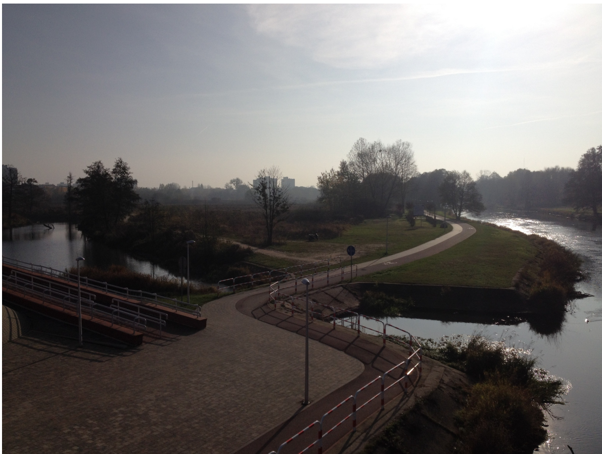
Fot. 23. Widok z Mostów Królewskich na ciąg pieszo-rowerowy.