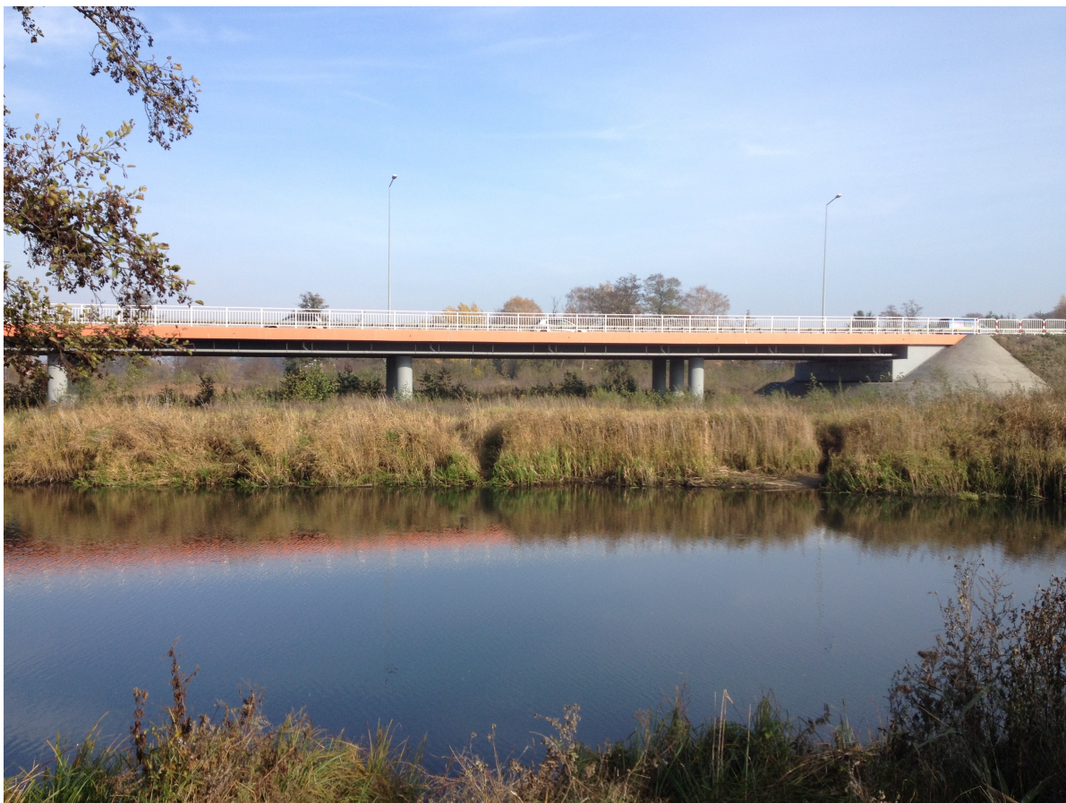
Fot. 21. Estakada w ciągu Mostów Królewskich.